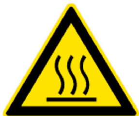
Advarsel, varm flate