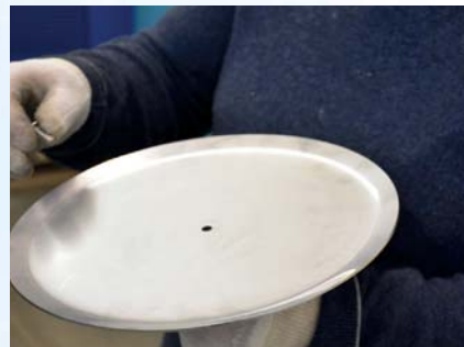
Sentrer platen mot hullet i staget