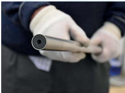
Finn frem staget og enden med mottager