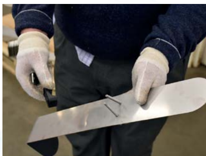
Vend platen slik det er avbildet