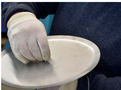
Sett inn skruen og skru fast