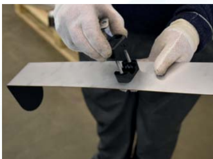
Fest motstykket til klemmen