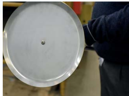
Slik skal monteringen sitte