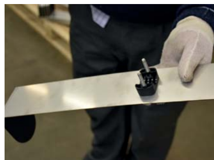
Sette på festeklemmen som avbildet