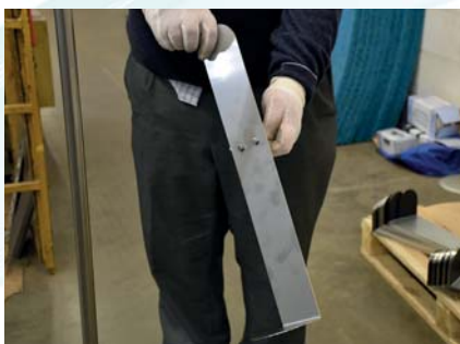
Sett 2 skruer gjennom hullene i platen