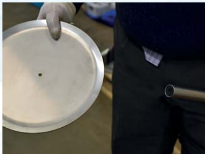
Finn frem gulvplaten og sørg for at den buede enden peker mot staget