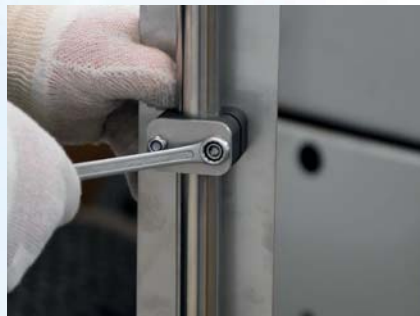
Stram til muttere med 10mm fastnøkkel