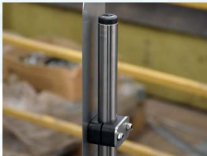
Slik ser riktig montering ut