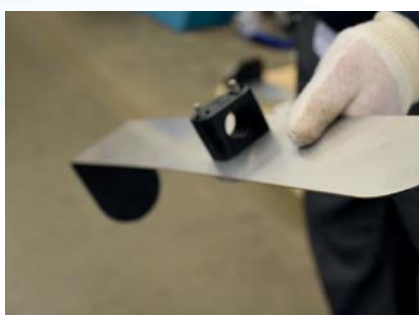
Festeklemmen skal nå være som avbildet