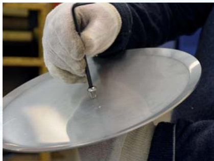
Stram til med 5mm umbraco nøkkel